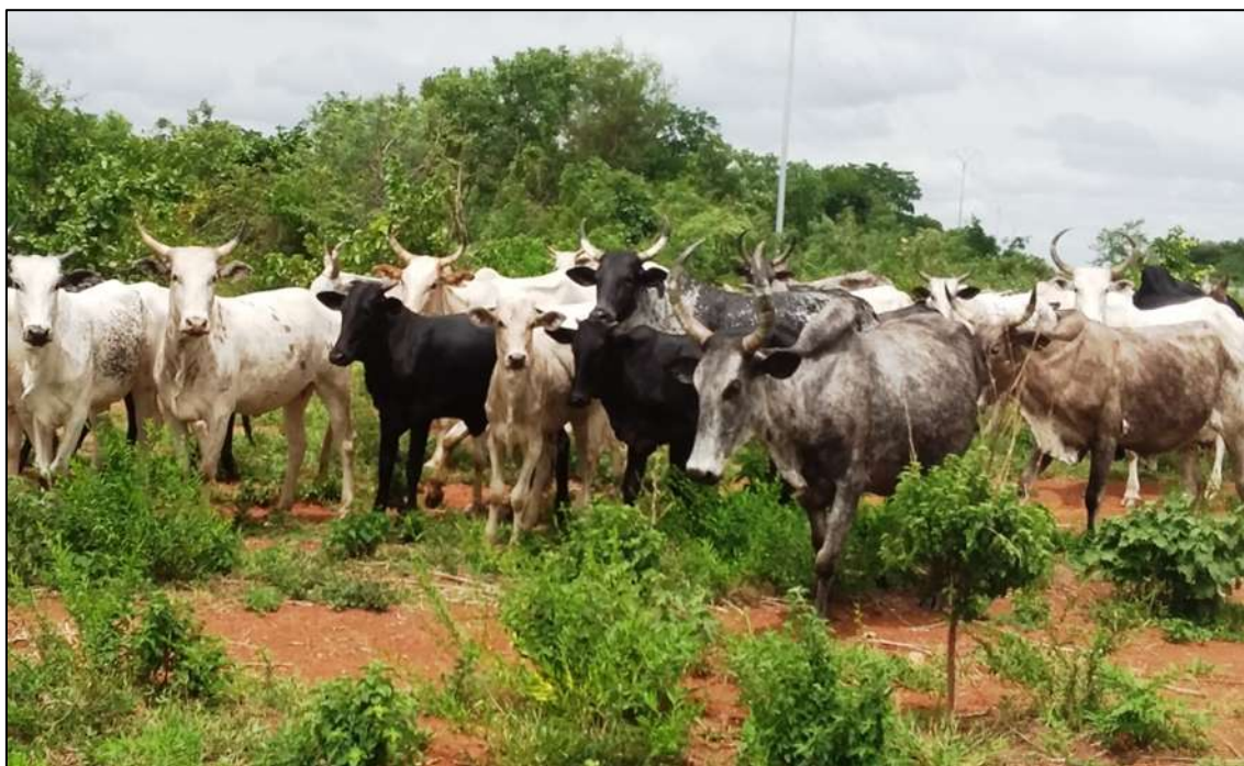
Bovins en transhumance au Togo