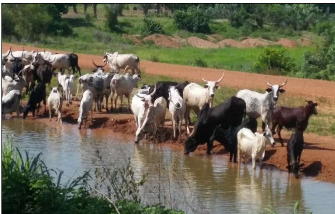
Bovins en transhumance au Togo s'abreuvant

En dehors des cours d'eau permanents (Oti, kara, Mono, Haho, Zio), les autres sources d'eau de surface et les mares sont partiellement asséchées au nord et elles ont commencé par se remplir au sud. Au sud du Togo le remplissage des mares et des rivières se poursuit encore.